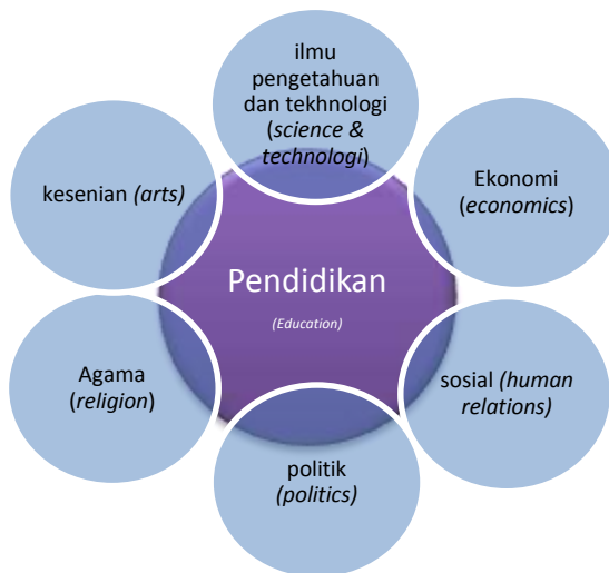
Gambar 1. Interrelationships of Institution 22

Dari gambar tersebut terlihat bahwa semua mata rantai saling mendukung dan berkaitan dengan menjadikan institusi pendidikan sebagai sentral terhadap institusi-institusi lainnya. Terlebih, dapat dilihat pula bahwa untuk mengatasi masalah tantangan global maupun lokal tidak pernah lepas dari peran suatu lembaga pendidikan. Lebih khusus lembaga pendidikan islam yang mempunyai peran ganda, yakni sebagai pewaris budaya melalui pendidikan sistem nilai dan kepercayaan, pengetahuan dan norma-norma, serta adat kebiasaan dan berbagai perilaku tradisional yang telah membudaya diwariskan pada suatu generasi ke generasi berikutnya.